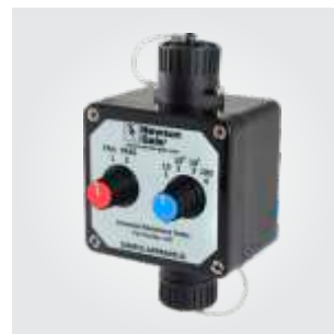
Universal-Widerstandsprüfer Produktcode: URT