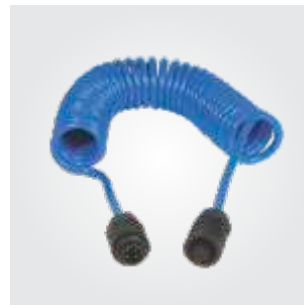
Cen-Stat-Kabel mit Schnellkupplungen in Stecker sowie Buchsenausführung.

Wenn die Klammer nicht genutzt wird, zieht sich das Spiralkabel zusammen, sodass es ordentlich und sicher gelagert werden kann.